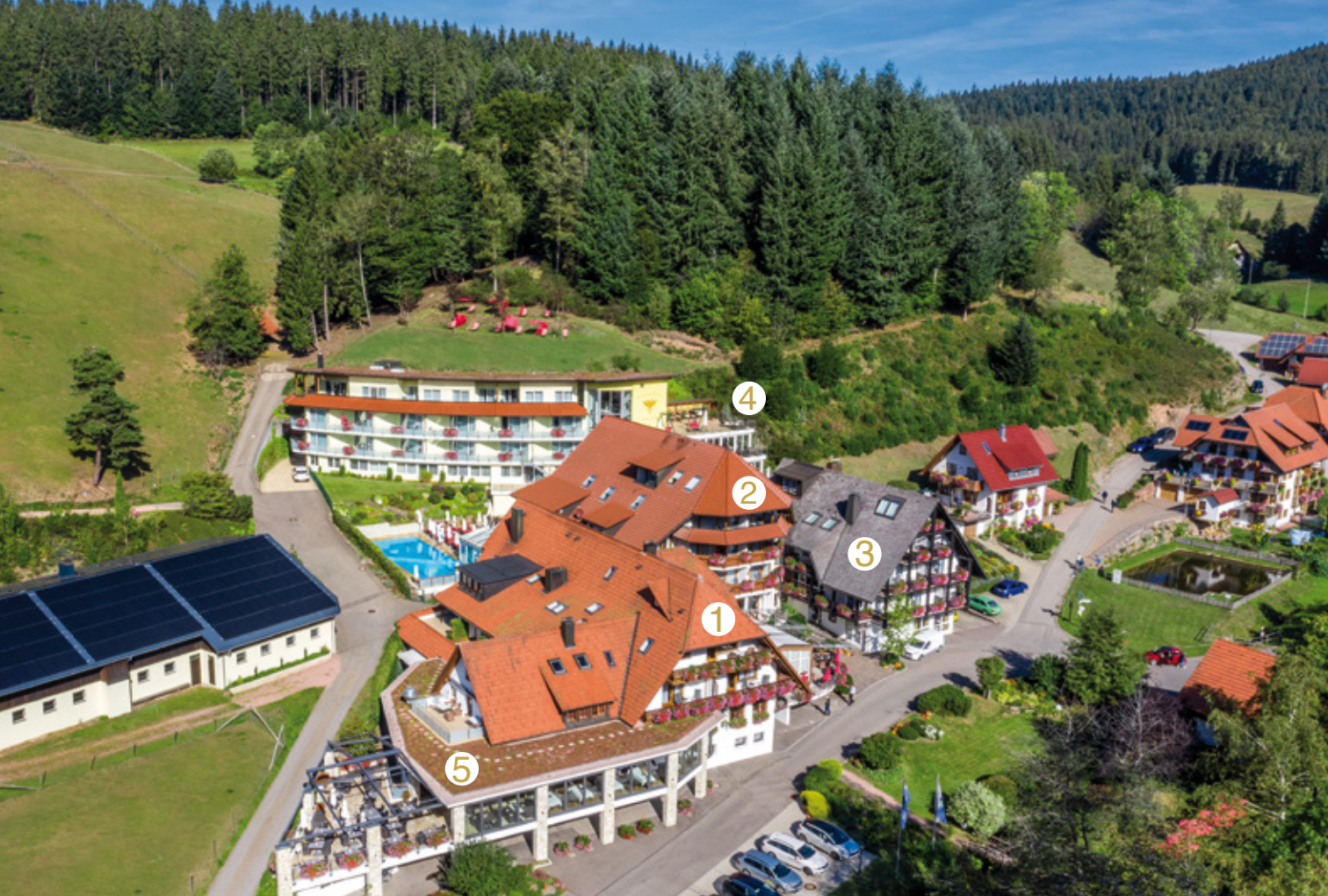
1. Stammhaus / 2. Haus Sonnenbühl / 3. Landhaus / 4. Haus Adlerhorst / 5. Süd-Terrasse »Kirchblick«